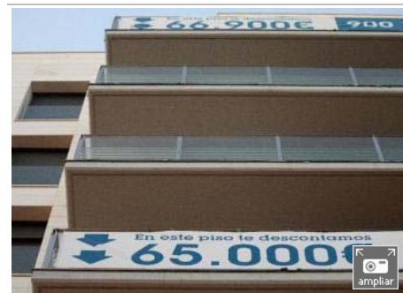
Viviendas de Habitat en venta con anuncios de descuento.